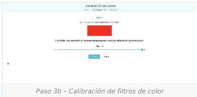
Paso 3b - Calibración de filtros de color