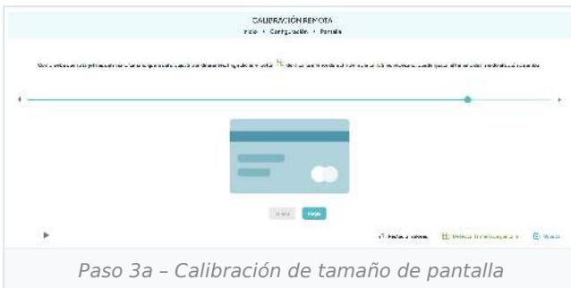
Paso 3a - Calibración de tamaño de pantalla

En sesiones posteriores no tendrás que repetir la calibración.